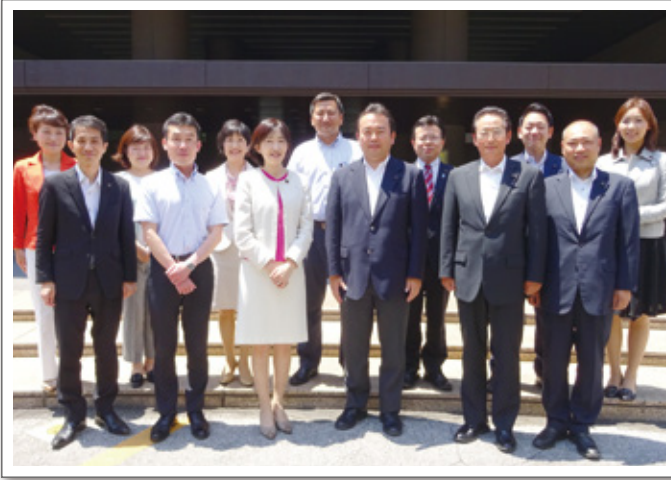
埼玉県議会議事堂前にて新メンバー集合写真

発行元：民主党・無所属の会 〒330-0063 さいたま市浦和区高砂3-15-1 TEL 048-833-1710 FAX 048-833-1722 E-mail minshuto@gikai.pref.saitama.jp